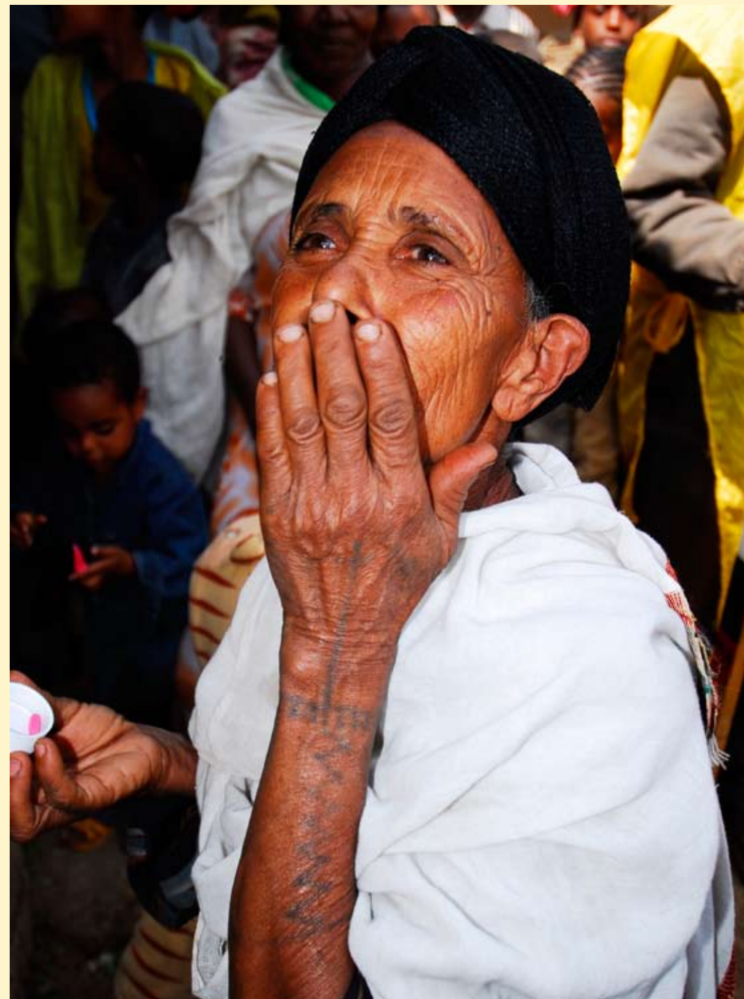
Podání antibiotika v oblasti Silti – prevence trachomu, foto Vladislav Veselý (místopředseda představenstva)