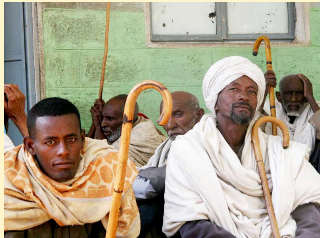
Pacienti čekají na vyšetření zraku před klinikou v Zeway

V prosinci byla uzavřena dohoda o vzniku mezinárodní konfederace Light for the World sdružující české SVĚTLO PRO SVĚT, rakouský LICHT FÜR DIE WELT a belgické LUMIÈRE POUR LE MONDE / LICHT VOOR DE WERELD. Tato užší spolupráce přinese další zvýšení efektivnosti a hospodárnosti práce jednotlivých organizací LIGHT FOR THE WORLD – lepší projektové řízení, efektivněji využití finanční prostředky a také silnější a úspěšnější prosazování práv osob se zdravotním postižením na půdě EU i domácích zákonodárných sborů.